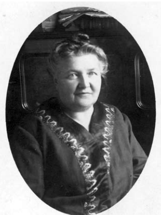
Liudvika Didžiulienė-Žmona į istoriją įėjo ir kaip pirmosios žinomos gastronominės knygos lietuvių kalba autorė.