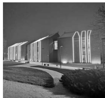
Konkurse „Šviečiantys Anykščiai“ dalyvavo ir Anykščių L. ir S. Didžiulių viešoji biblioteka, kurios apšvietimą kai kurie profesionalūs architektai vertina kritiškai.