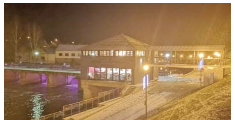
Restoranas „BasiBasi“ lankytojus prima dviejuose aukštuose.